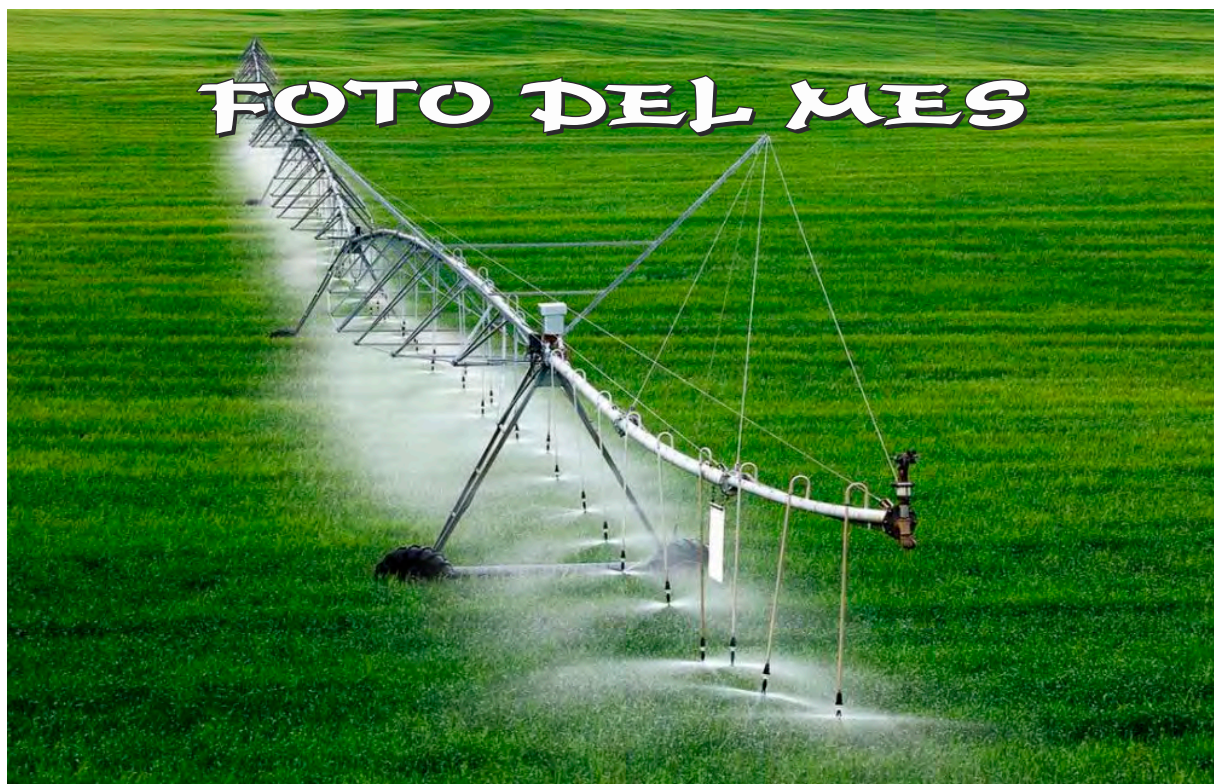
La sequía adelanta mes y medio el riego